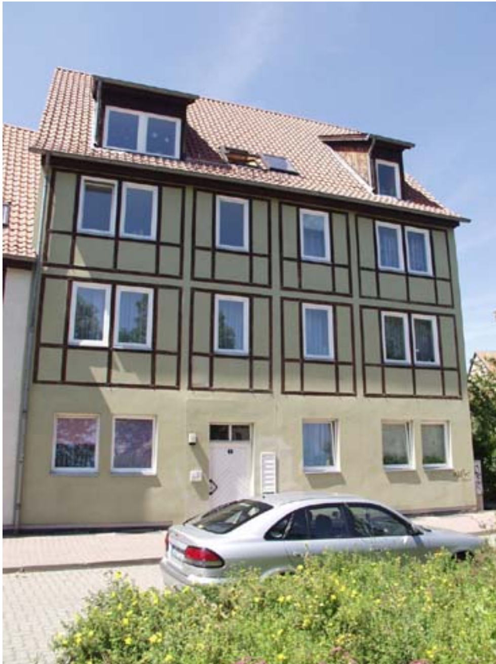
Die Straßenansicht des Gebäudes zur Grabengasse

Die Planung und Bauvorbereitung des Wohngebietes Grabengasse/Dippeplatz erfolgte in den Jahren 1988/89. Die Übergabe der Bauten fand in den Jahren 1990/91 statt. Die Gebäude sind damit typische „Wendewohnungen“. Sie wurden in der sogenannten HMBQ-Bauweise (Hallesche Monolithbauweise für Quedlinburg) errichtet, d.h. mit Hilfe eines speziellen Schalungssatzes gegossen. Die Bauweise wurde entwickelt, um die Neubauten den historischen Fachwerkbauten anzupassen. Die Stadtwerke versorgen die Eigentumsanlage mit Fernwärme und Warmwasser.